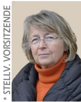
* STELLV. VORSITZENDE