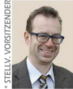
* STELLV. VORSITZENDER