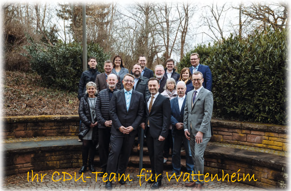
Ihr CDU-Team für Wattenheim